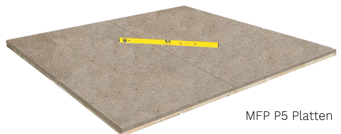
MFP P5 Platten

Fußbodenelemente* von unten behandeln, zusammenlegen, umdrehen und mit einer Wasserwaage ausrichten.